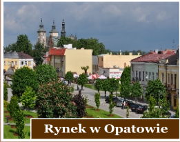
Rynek w Opatowie

Opatowski rynek charakteryzuje średniowieczny układ oparty na planie szachownicy. Jest jednym z największych rynków w Polsce. Na tablicy znajdują Państwo m.in. informacje na temat historii oraz rozwoju przestrzennego Opatowa.