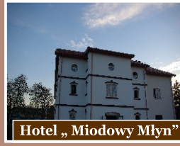
Hotel „Miodowy Młyn”

Stanowisko to wyznaczono w celu upamiętnienia dawnego młyna, który funkcjonował w tym budynku do lat 90 XX w. Pierwotnie był to młyn wodny z kołem mącznym, napędzanym wodą ze stawu na rzece Łukawka. Obecnie w budynku mieści się hotel.