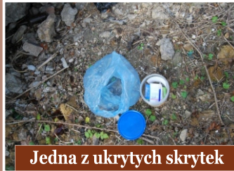
Jedna z ukrytych skrytek

Odkryj Opatów na nowo! Zapraszamy osoby, które nie boją się przygód do geocachingu, czyli poszukiwania 10 skrytek ukrytych w interesujących miejscach Opatowa. Pierwszym krokiem, jaki trzeba podjąć, żeby wziąć udział w zabawie jest rejestracja na stronie internetowej www.opencaching.pl . Na tej stronie znajdują Państwo także informacje na temat ukrytych skrytek, ich współrzędnych geograficznych i wskazówek pomocnych przy poszukiwaniu ich w terenie. Gdy znajdą Państwo skrytkę należy odnotować ten fakt w załączonym notesie. Przydatne podczas poszukiwania skrytek odbiorniki GPS mogą Państwo pobrać w Hufcu ZHP w Opatowie przy ul. Partyzantów 13. Odnalezienie 10 skrytek na terenie Opatowa umożliwi Państwu założenie pierwszych własnych skrytek, ponieważ zasady gry mówią, że gracz może zacząć zakładać własne skrytki w momencie gdy odnajdzie min 10. w terenie.