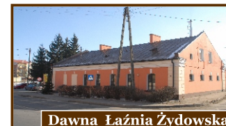
Dawna Łaźnia Żydowska

W ramach projektu na wybranych zabytkowych budynkach Opatowa umieszczono szklane tabliczki upamiętniające dawniej istniejące w tym miejscu obiekty lub ich funkcje.