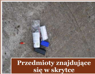
Przedmioty znajdujące się w skrytce

Uczestnicy geocachingu mają możliwość uzyskania odznaki PTTK GEOCACHING POLSKA. Wszelkie informacje na temat kryteriów przyznawania odznaki oraz pozostałe ważne wiadomości na temat gry znajdują Państwo na stronie www.geocaching.pl .