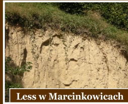
Less w Marcinkowicach

Położony na wyżynie lessowej Opatów oraz jego okolice to miejsca kształtowania się w podłożu wąwozów i parowów. W miejscowości zlokalizowanej w sąsiedztwie Opatowa o nazwie Marcinkowice możemy podziwiać tego typu formy oraz zachodzące w ich obrębie procesy.