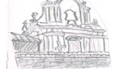
Klasztor OO. Bernardynów