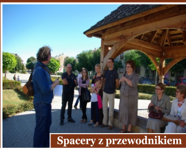
Spacerzy z przewodnikiem

Projekt przewidywał również realizację Opatowskich Spacerów z Przewodnikiem „szlakiem opatowskich ciekawostek”. We wrześniu br. odbyły się 3 spacerzy sfinansowane z budżetu projektu.