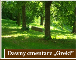
Dawny cmentarz „Grecki”

Opatów jest miastem, w którym już od XVI wieku mieszały się różna kultura i narodowości dzięki czemu można tu odnaleźć cmentarz grecko - orientalny oraz cmentarz żydowski czyli kirkut.