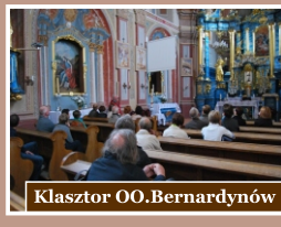
Klasztor OO. Bernardynów

W skład kompleksu budynków z II poł. XV w. wchodzi budynek klasztoru oraz barkowy kościół p.w. Wniebowzięcia NMP. Budowle powstały w miejscu najstarszej opatowskiej osady zwanej Żmigrodem. Na tablicy ukazano m.in. historię klasztornej wzgórza.